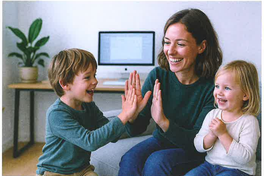
Bei Teilzeit sollten Paare und Familien ihre soziale Absicherung sorgfältig analysieren.

Dem Risiko bei Todesfall sollte man als Familie oder Paar (verheiratet, eingetragene) ebenfalls Aufmerksamkeit schenken. Hier steht die finanzielle Situation der Hinterbliebenen im Fokus. Bei einem Unfalltod greifen die Leistungen von AHV und Unfallversicherung, die – mittels Witwen- oder Witwerrente – zusammen bis zu 90 Prozent des entgangenen Lohn Einkommens der verstorbenen Person decken und so den Einkommensverlust ein Stück weit kompensieren. Bei einem krankheitsbedingten Todesfall fällt die finanzielle Absicherung für die Hinterbliebenen deutlich tiefer aus. Wo Teilzeitpensen im Spiel sind, ist es als Familie oder