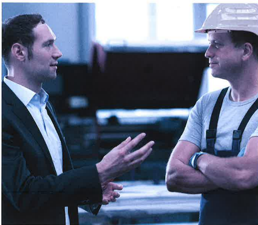
Das Mitarbeitergespräch ist keine Nebensache. Nehmen Sie sich Zeit und hören Sie zu.

Die ausschliessliche Konzentration auf objektiv messbare Ziele wird den Qualitäten und Bedürfnissen des einzelnen Mitarbeitenden nicht unbedingt gerecht. Zunehmend wichtiger sind sogenannte agile Ansätze. Sie lenken den Blick zum Beispiel auf Werte wie eigenständiges Arbeiten und funktionsübergreifende Zusammenarbeit. Dies kommt auch den heutigen Erwartungen der Mitarbeitenden entgegen, die flachere Hierarchien und mehr Eigenverantwortung bevorzugen. Grundlage für einen solchen Ansatz bilden das Vertrauen in die Mitarbeitenden und ein Führungsverständnis, das auf Coaching des einzelnen Mitarbeitenden setzt. Gestalten Sie das Mitarbeitergespräch als Dialog auf Augenhöhe und nutzen Sie es, um die Stärken, Wünsche und Ziele Ihrer Mitarbeitenden kennenzulernen und darauf weiter aufzubauen – also die «Stärken zu stärken». Agile Führung bedeutet auch, dass Sie Aufgaben an die Mitarbeitenden abgeben und gemeinsam mit ihnen die besten Lösungen für Herausforderungen finden. Lassen Sie diese Aspekte in die Leistungsziele einfließen.