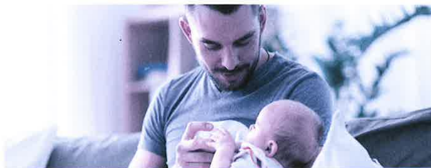
Vaterschaftsurlaub: innert sechs Monaten nach der Geburt zu beziehen.

Das Unternehmen muss dem Vater zehn arbeitsfreie Tage gewähren und hat für diese Zeit Anspruch auf 14 Taggelder. Es ist Sache des Arbeitgebers, bei der Ausgleichskasse – welche auch die EO-Beiträge abrechnet – den Antrag auf die Vaterschaftsentschädigung zu stellen. Der Antrag sollte aber erst gestellt werden, wenn der Arbeitnehmer den ganzen Vaterschaftsurlaub bezogen hat und der Arbeitgeber dies mit dem Antrag bestätigen kann. Die Auszahlung der Vaterschaftsentschädigung erfolgt dann nachgelagert