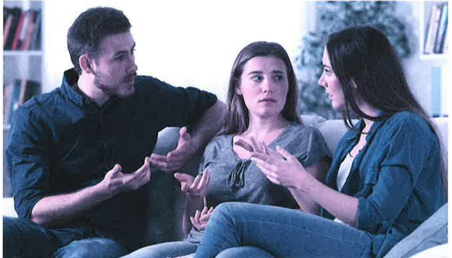
Kommt es zum Streit zwischen den Erben, muss der Willensvollstrecker schlichten.

Der Willensvollstrecker setzt den letzten Willen des Erblassers um. Dafür stellt er als Erstes ein Inventar auf, das er laufend nachführt. Er verwaltet die Erbschaft bis zur Teilung und muss darauf achten, dass das Vermögen erhalten bleibt. Er bezahlt die Schulden des Erblassers inklusive der Todesfallkosten und treibt offene Forderungen ein. Zur Verwaltung gehören auch die laufenden Geschäfte, beispielsweise muss er sich um den Unterhalt von Liegenschaften kümmern, laufende Verträge kündigen oder allenfalls die Liquidation einer Einzelunternehmung umsetzen. Er ist verantwortlich für die Erstellung der